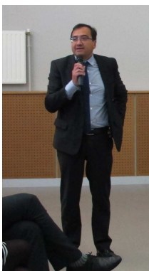
Monsieur le Maire