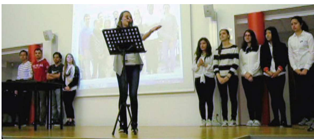
Madame la représentante de la Société Générale