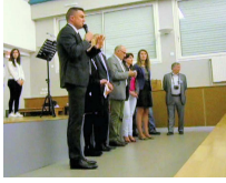
Monsieur le Principal

... préparer les élèves... projet interdisciplinaire... échanges... partage de savoirs et d'expériences... enrichi par des apports extérieurs... connaître les attentes du monde professionnel... projet de solidarité envers les plus jeunes... ...travail de qualité... ...une première pour le collège Merci aux partenaires qui ont cru au travail des élèves !